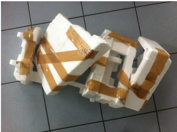
Lot de PSE blanc avec étiquettes ou scotch \geq 50% de la surface