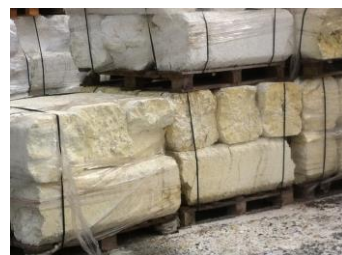
PSE blanc légèrement jauni