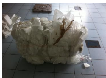
PSE conditionné en balles