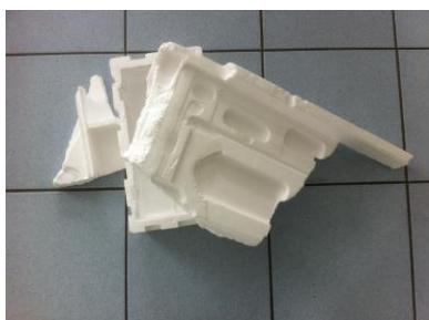
PSE blanc et propre