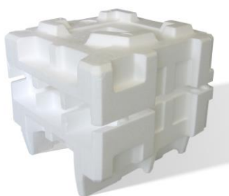
PSE blanc et propre