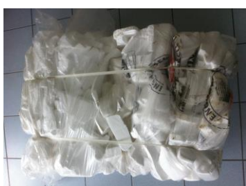
PSE conditionné en balles