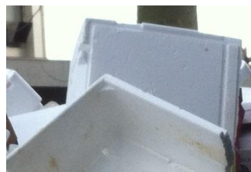
Caisses poissons avec présence de quelques écailles