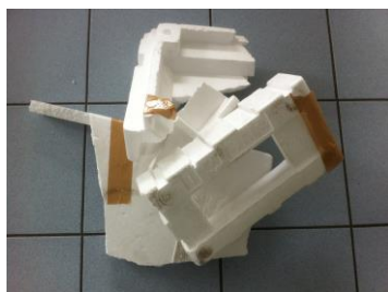
PSE blanc avec scotch ou étiquette