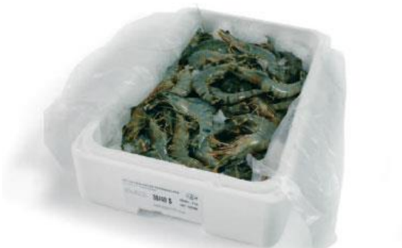
PSE avec présence (faible ou forte) de crustacés ou poissons

ET TOUTE PRESENCE DE GRAVATS, CIMENT, PLATRE EST A PROSCRIRE ET ENTRAINE UN REFUS DU LOT DE PSE