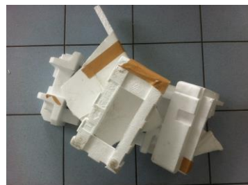
PSE blanc avec scotch ou étiquette