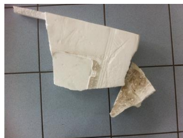
PSE blanc avec salissure